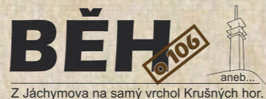
Z Jáchymova na samý vrchol Krušných hor.

8:15 AUTOMOBILOVÉ ZÁVODY DO VRCHU – důl Svornost I Štola č. 1 8:15–10:00 trénink 11:00–14:00 soutěžní jízdy 17:00 předání cen 09:00 ROZCVIČKA – piknik v trávě I lázeňský park 10:00–13:00 CYKLOVÝLET – na bicyklu bez námahy, lanovkou na Klínovec, lesními cestami zpět, 20 km 10:30 NORDIC WALKING – 5 km vycházka s instruktorem po obnovené malebné Mlýnské stezce 12:00 BĚH O 106 klasik – start Jáchymov I cíl – Klínovec, délka 6 km, převýšení 600 m 12:30 BĚH O 106 mini – start I cíl Jáchymov před Lázeňským centrem Agricola, délka 2/4/6 km dle věkové kategorie + překážková dráha pro nejmenší I více informací na www.beho106.cz 16:00 VYHLÁŠENÍ VÝSLEDKŮ ZÁVODU O 106